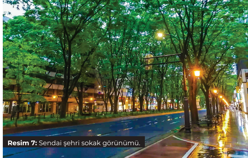
Resim 7: Sendai şehri sokak görünümü.

1600 yılında "Date Masamune" tarafından kurulan kent, "ağaçların şehri" adıyla da bilinir (Resim 7). Myagi prefektörlüğünün merkezidir ve Tohoku bölgesinin en büyük şehridir. 2013 yılı verilerine nüfusu 1 milyon civarındadır. Şehir içi ulaşım otobüsler, metro ve bisikletlerle sağlanmaktadır. Şehirlerarası ulaşım ise yine otobüsler ve hızlı trenler (Shinkansen) ile sağlanmaktadır. Sendai Station'dan (Resim 8) şehirlerarası tüm biletler temin edilebilir. Alışveriş için birçok market (7/11, Lawson's) 7/24 esasına göre hizmet vermektedir. Bu marketlerden hazır ye-