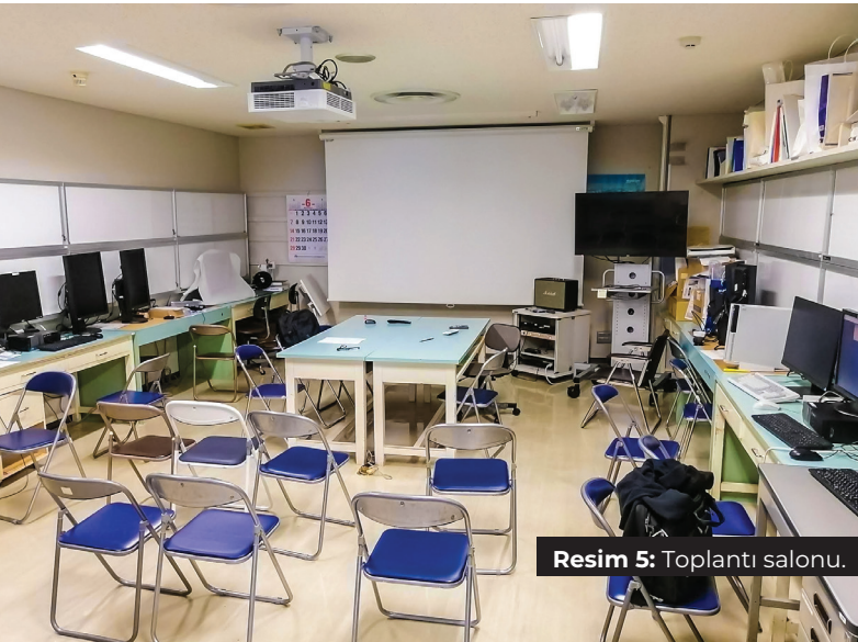
Resim 5: Toplantı salonu.