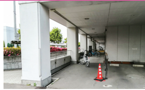
Resim 1 ve 2: Kohnan Hastanesi ana girişi ve bisiklet parkı.