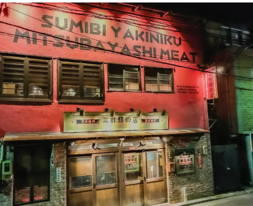
Resim 10: Bir ocakbaşı restoran.

Sendai'de İngilizce bilen kişilere rastlama olasılığınız oldukça düşüktür. Bu sebeple Google translate'in metin ve kamera özelliklerini kullanmanız mutlak surette gerekecektir. Hastane içerisinde de aynı durumu yaşayacağınızdan dolayı günlük kullanım için yirmi kadar Japonca kelime öğrenmek rahat etmenizi sağlayacaktır. Hastanede gün içinde ekipten hiç kimsenin sizinle ilgilenmediğini göreceksiniz. Bu durum elbette moral bozukluğu yaratacaktır. Ancak aynı ekiple akşam yemeklerine çıktığınızda karşılaşacağınız samimiyet sizi şaşırtacaktır. Fakat bu samimiyetin hastanedeki durumu değiştirmeyeceğini bilmeniz gerekir.