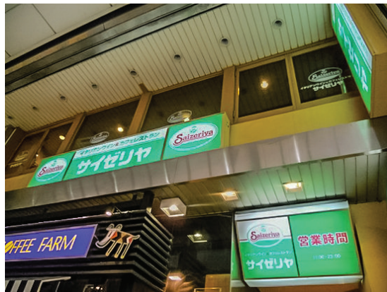
Resim 11: Saizeria İtalyan restoranları.