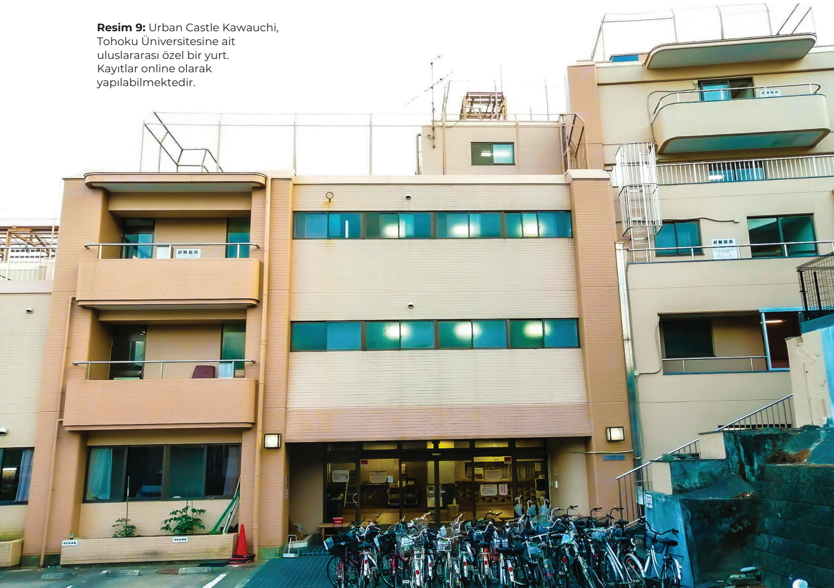
Resim 9: Urban Castle Kawauchi, Tohoku Üniversitesine ait uluslararası özel bir yurt. Kayıtlar online olarak yapılabilmektedir.

Telefon şarjı için yanınızda uluslararası tipte şarj adaptörü bulundurmanız gerekir. Telefon hatları oldukça pahalı olduğu için 6 ay gibi kısa süreli konaklamalarda alınması önerilmiyor. Şehir içinde gezerken marketlerdeki ücretsiz wi-fi'lar kullanılabilir.