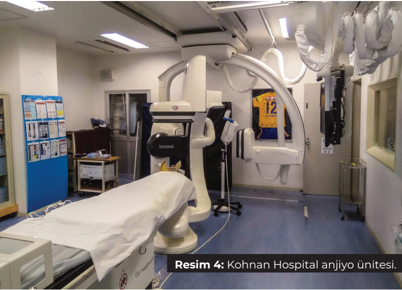
Resim 4: Kohnan Hospital anjiyo ünitesi.

Elektif vakaların hepsinde malzeme hazırlığı için fellowlara fırsat verilmektedir. Yıkama sıvıları, balonlar ve her çeşit sheath'in nasıl hazırlanacağını bilmek endovasküler cerrahi için temeldir. Vaka sırasında soru sorma fırsatı pek bulamayacağınızdan ötürü her vaka için çalışarak gelmek faydanıza olacaktır. "Handbook of Neuroendovascular Surgery" adlı kitabı Türkiye'de iken temin etmek gerekmektedir.