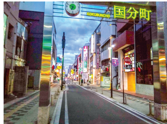
Resim 12: Kokobunco mevkii.