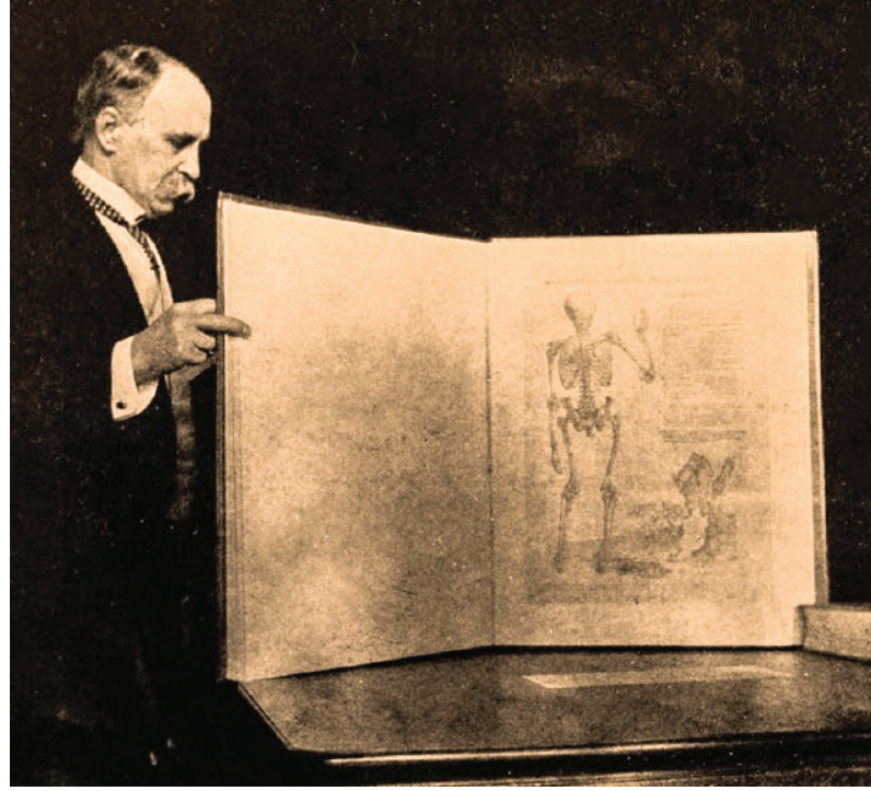
Osler'in, Vazelius'un kitabını açık bir şekilde gösterirken çekilmiş bu fotoğrafını, Oslerin ölümünden hemen sonra arkadaşı Cushing yayınlamıştır.

Dr. Cushing'den neredeyse yarım yüzyıl sonra, Dr. Mahmut Gazi Yaşargil, o zamanlarda Nöroşirürji alanına giren ataleti yenerek, nöroşirürjiye yeni bir atılım ve yön vermiş, en büyük beyin cerrahları ara-