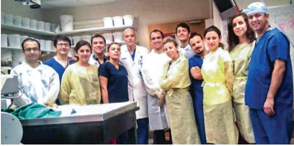
Dr. Başkaya Kafatabanı Laboratuvarı fellowları ile birlikte, 2016.