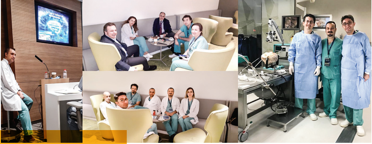
Acıbadem Case Laboratuvarı, Şubat 2020, 2. Kafa tabanı Kursu.

ve uluslararası standartlarda diseksiyonlar ve yayınlar üreten pek çok laboratuvar vardır. Bu laboratuvarlarda görev alan nöroşirürjenlerin birbirleriyle şehirler arasında görünmez bağları vardır.